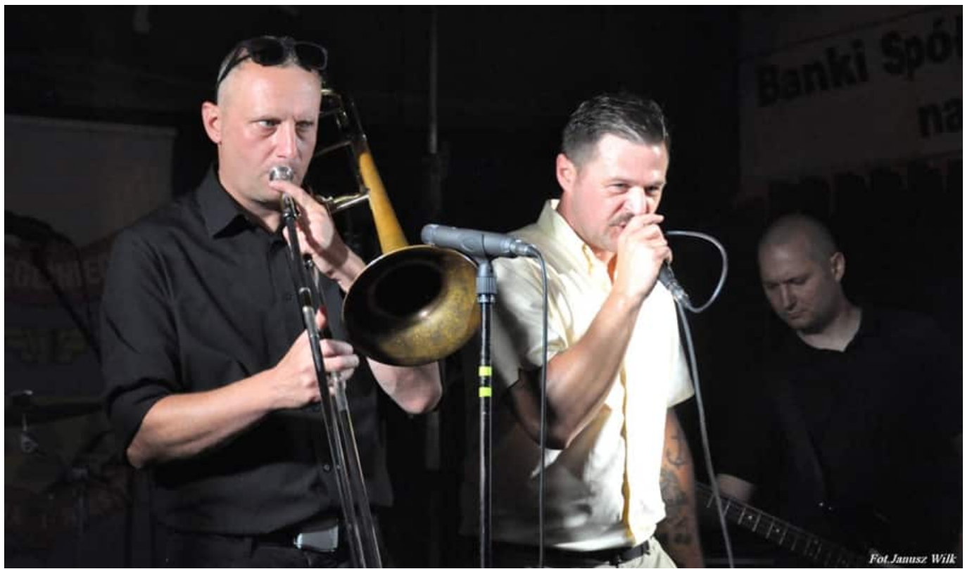
Fot. Janusz Wilk