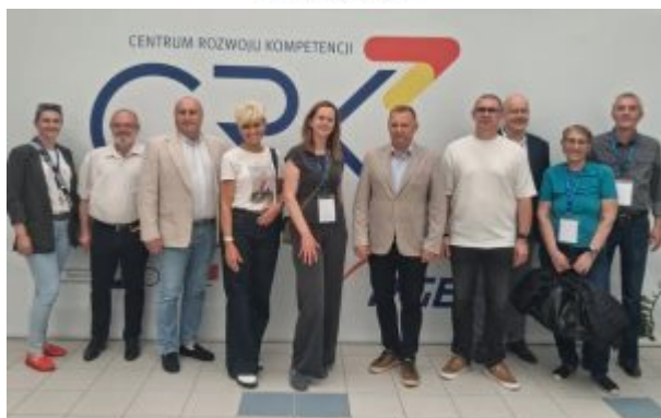
KONFERENCJA BRANŻOWA „POTRZEBY EDUKACYJNE NA MIARĘ XXI WIEKU” WOLA GROZYMAŁINA, 27.05.2025R.