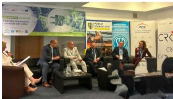
KONFERENCJA BRANŻOWA „POTRZEBY EDUKACYJNE NA MIARĘ XXI WIEKU” SŁICE - MATEM, 26.05.2025R.